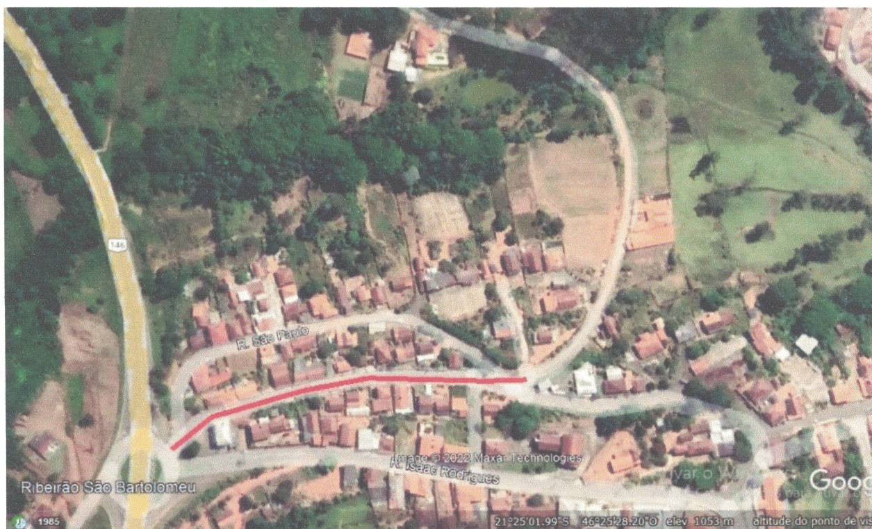
Rua dos Palmas – EXISTENTE (em vermelho)

Home page www.caboverde.mg.gov.br E-mail caboverde@caboverde.mg.gov.br